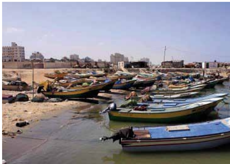
Fiskebåter ligger til land. Fiskere fra Gaza risikerer å bli beskutt og å få konfiskert båten sin. Bildet er fra bloggen Fishing Under Fire, se http://fishingunderfire.blogspot.com

Muren som Israel har bygget for å skille palestinere og israelere fra hverandre, er også et klart brudd på menneskerettighetene. Muren er ikke bygd på noen anerkjente grenser, men slynger seg gjennom landskapet. Israellere merker svært lite til muren, for den står gjerne flere kilometer unna nærmeste israelske hus, mens den står helt oppe i veggen til et palestinsk hus. I dag er det mange som må reise i timevis for å komme seg på jobb på grunn av muren, og mange kommer seg aldri på jobb. Det som tidligere var av palestinske brønner