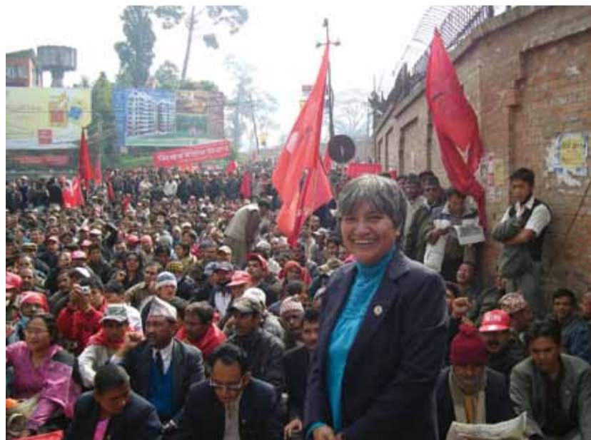
Fra blokaden. Hisila Yami, tidligere statsråd og sentral kvinnepolitiker, i front.

Lederen for kuppmakerne, Roberto Micheletti, har beordra folket om å levere inn sine våpen. Opposisjonen blir forfulgt og mediene underlagt sensur.