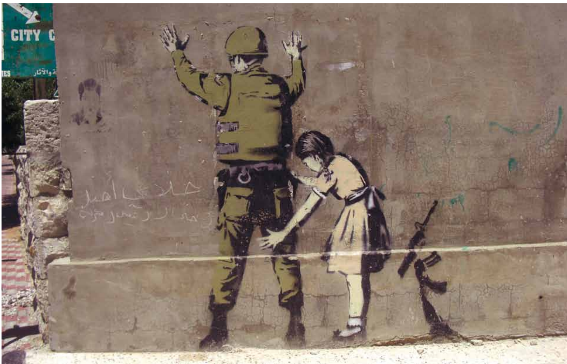
Denne graffitten er laget av en kunstner som heter Banski. Han har laget mange flotte bilder på Skammens mur. Dette er i Betlehem. Bilder av Banski: http://tinyurl.com/s4ac3