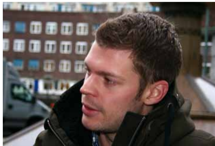
Moxnes er leder for Rødt's bystyregruppe i Oslo.

– Norge må kreve at den lankesiske regjeringa slipper tamilene i interneringsleirene fri. Det haster.