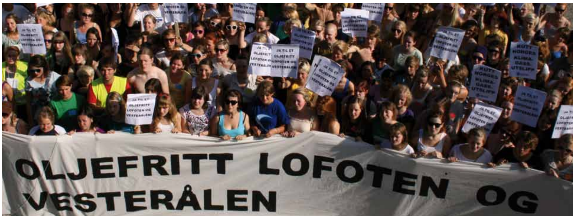
Frå demonstrasjon.

Sterke interesser ønsker meir oljeboring i nordområda. Men den folkelege motstanden, med Folkeaksjonen Oljefritt Lofoten, Vesterålen og Senja i spissen, er i auke og klare for kamp.