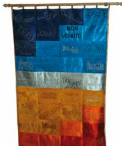
Lappeteppe med «Velkommen» på 36 språk, lagd av sjuende klasse på Tøyen.

En sjekk i statistikken viser at i Oslo får bare én av tjue minoritetsspråklige elever morsmålsopplæring sammen med tospråklig fagopplæring dette skoleåret. I motsetning til mange andre oslo-skoler har Tøyen skole, en barneskole hvor 96 prosent av barna er minoritetsspråklige, satset på slik opplæring.