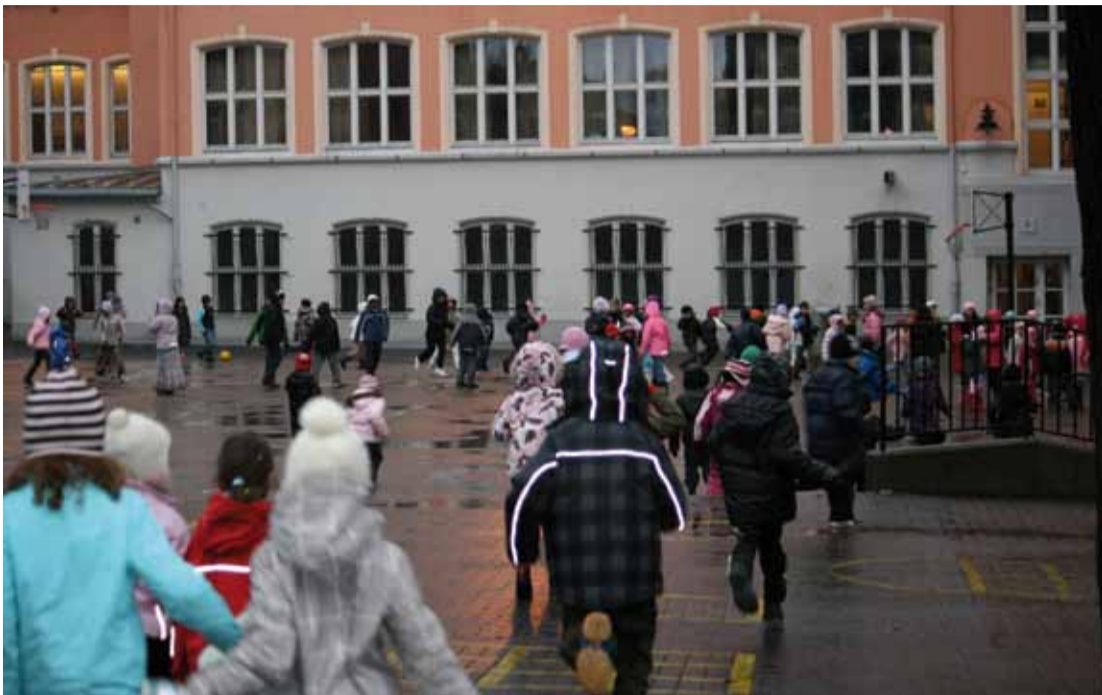
Da klokka klang ... Friminuttet er over på Tøyen skole.

– Hos oss har alle klasser en norsk lærer som kontaktlærer. Denne læreren har all undervisning i egen klasse. I tillegg har klassen en lærer til. Denne læreren kan være norsk eller tospråklig – og har mellom femti og hundre prosent av undervisningen sin i klassen.