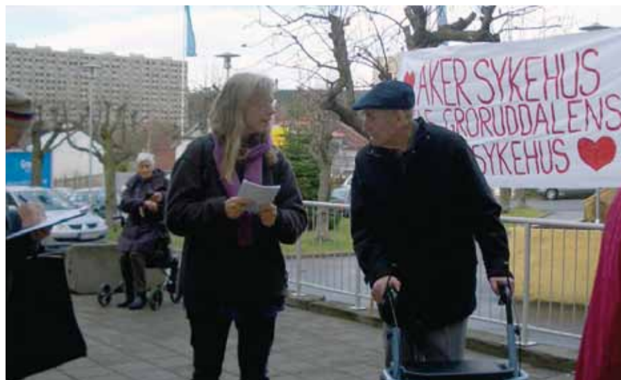
– Hvor kan jeg skrive under? Aksjon på Grorud i Oslo.

mange flere senger i årene framover. De oppfordrer deg til å gå inn på www.underskrift.no og Facebook-gruppa Nei til nedleggelse av Aker sykehus .